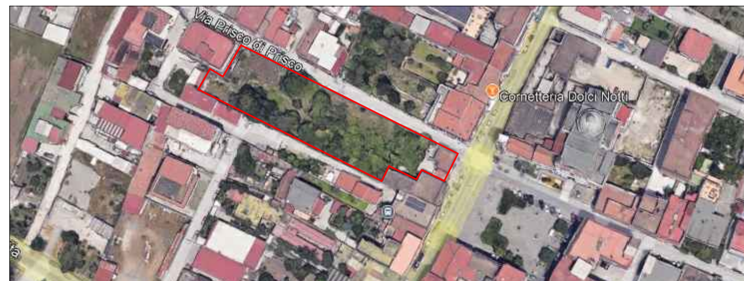
STRALCIO SATELLITARE - INDICAZIONE ZONA OGGETTO D'INTERVENTO